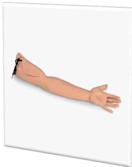
Suture Practice Arm