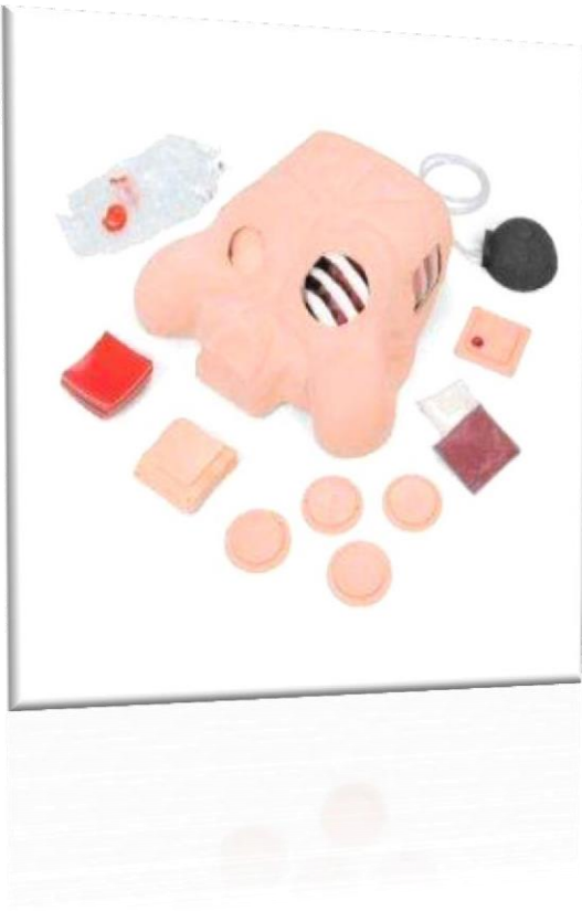
Chest Tube Manikin